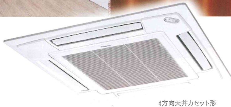
4方向天井カセット形

新冷媒R32を使用した、最新の空調設備です。 センサーを搭載したものや特殊用途のものまで、 幅広く取り扱っています。