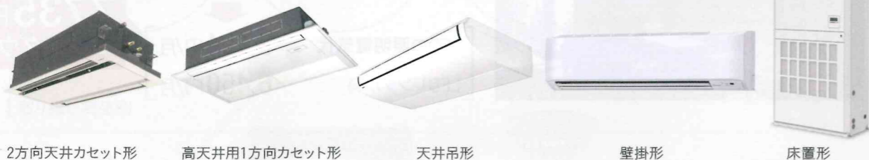
2方向天井カセット形